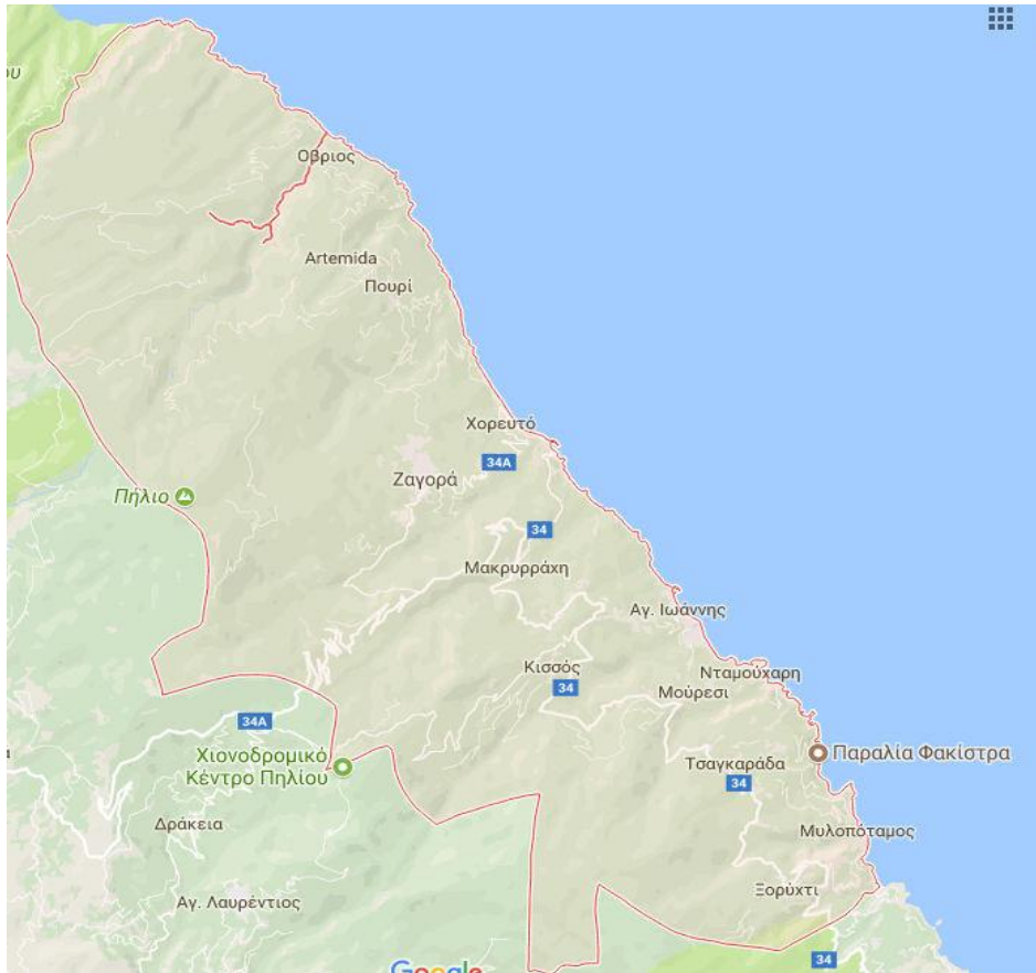
Χάρτης 3: Ο Δήμος Ζαγοράς-Μουρεσίου

Τα μέλη του Συνεταιρισμού εργάζονται για έναν κοινό σκοπό που είναι η μακροήμερευση της οργάνωσης, η οικονομική της αυτάρκεια, οι επιτυχημένες οικονομικές εκκαθαρίσεις των προϊόντων τους και η αλληλεγγύη των μελών τους (π.χ. σε περίπτωση προβλημάτων υγείας, καταστροφών, κ.ά.). Τα μέλη του Συνεταιρισμού δουλεύουν εκτός από τα κτήματά τους και για τις ανάγκες της οργάνωσης όλο τον χρόνο εκ περιτροπής στο συσκευαστήριο-ψυγείο της οργάνωσης (συνεργεία διαλογής φρούτων). Παράλληλα, αρκετά μέλη, νέοι και νέες της περιοχής, εκπαιδεύονται σε προγράμματα, ημερίδες και εκπαιδευτικά ταξίδια με σκοπό τη βελτίωση της καλλιέργειας της μηλιάς. Ο Συνεταιρισμός της Ζαγοράς παρέχει στα μέλη του προϊόντα και υπηρεσίες, όπως κατάστημα γεωργικών εφοδίων, φυτοφαρμακείο, αποθήκη εφοδίων (λιπάσματα, σπόρους, δένδρυλλια κ.ά.), αλλά και είδη καθημερινής χρήσης (σούπερ μάρκετ). Παράλληλα, συνεισφέρει στην πολιτιστική ανάπτυξη της περιοχής (ενίσχυση πολιτιστικών συλλόγων, ενίσχυση δρώμενων, εκδόσεις) και ενισχύει τα σχολεία της περιοχής. Μαζί με τον Δήμο Ζαγοράς-Μουρεσίου