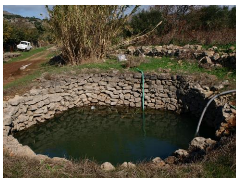
24. Δεξαμενή νερού με ξερολιθιά