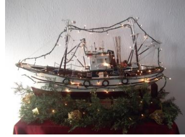
18.Το έθιμο του στολισμού του καραβιού για τη γιορτή των Χριστουγέννων