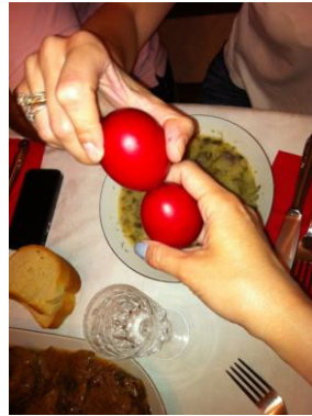
19.Το Πασχαλινό έθιμο των κόκκινων αυγών