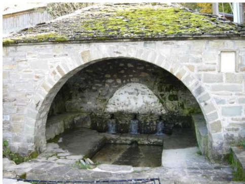
27. Δημόσια βρύση