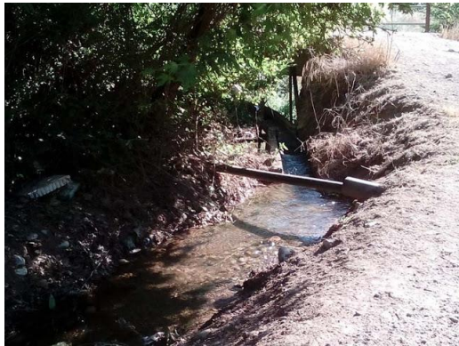
26. Αυλάκι για πότισμα