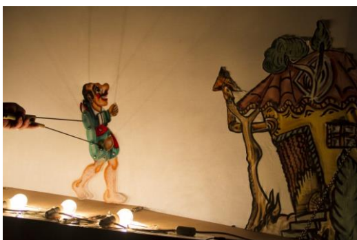
22. Θέατρο Σκιών-Καραγκιόζης