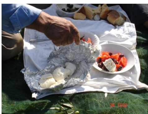
23. Μεσογειακή διατροφή