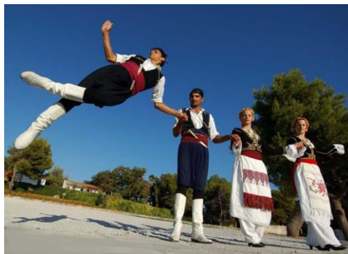
20.Παραδοσιακοί χοροί από την Κρήτη