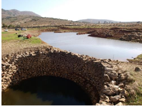
25. Δεξαμενή νερού