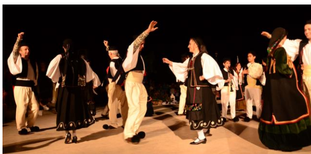
21. Παραδοσιακοί χοροί από την Ήπειρο